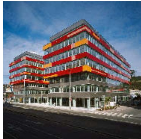
Das Smichov Gate in Prag wurde wie alle Projekte der Premiumred mit der Software abgewickelt.